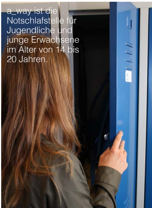
a_way ist die Notschlafstelle für Jugendliche und junge Erwachsene im Alter von 14 bis 20 Jahren.