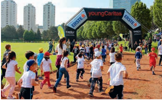
20.000 Kinder und Jugendliche machen jedes Jahr beim LaufWunder mit.