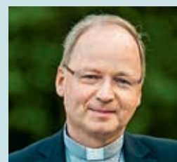
Ihr, Bischof Benno Elbs